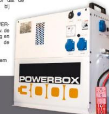
Abgebeeld: POWERBOX 3000 W.

De POWERBOX 3000 is als systeem CE gecertificeerd.